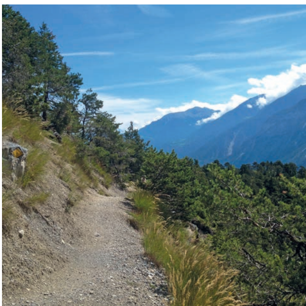
> Végétation rare au bord du bisse de Varone. > Rare vegetation on the edge of the Bisse de Varone.

Departure : Take the SMC bus to the Rétana stop after Mollens village. Arrival : Loèche. Regular buses to Sierre. Altitude : between 800 and 1,100 metres. A calm, 12.5 kilometre walk, about 4.5 hours.