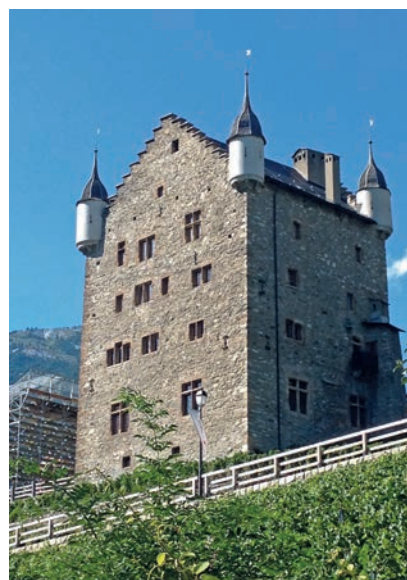
> Le château des Vidomnes avec son plan pentagonal. > The Château des Vidomnes with its pentagonal layout.