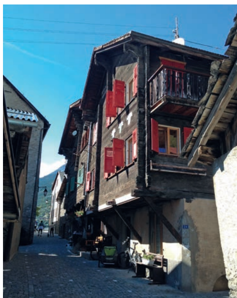
> Dans les rues de Loèche-Ville. > In the streets of Loèche-Ville.

> Le château épiscopal de Loèche, du Moyen Âge, qui servait de résidence d'été à l'évêque au 12 e siècle. Au sommet, les aménagements contemporains de l'architecte Mario Botta.